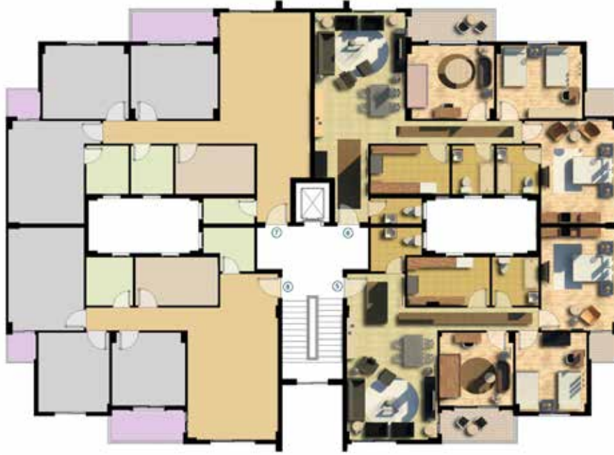
مسقط افقي للدور المتكرر