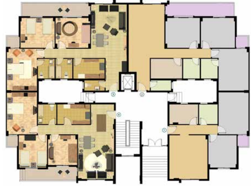
مسقط افقي للدور الارضي