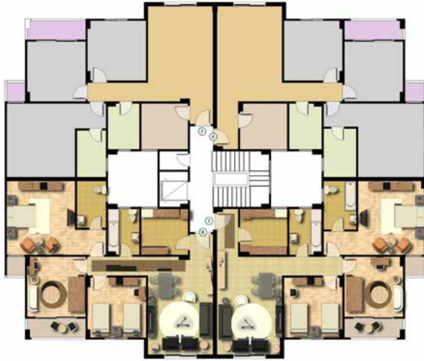
مسطح افقي للدور المتكرر